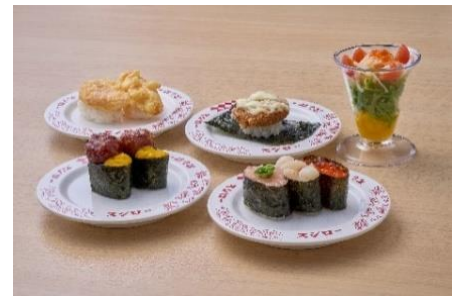
プラントベースのおすし5種

さまざまな背景をお持ちの方にもおすしをお楽しみいただくために、全商品をノーポーク・ノーラード※2でご提供いたします。豚骨不使用の「豚骨風ラーメン」や植物性由来の材料で作ったプラントベースのおすしなど、皆さまでお食事を楽しんでいただけるメニューをご用意しています。 ※2 二次原料までの確認となります。