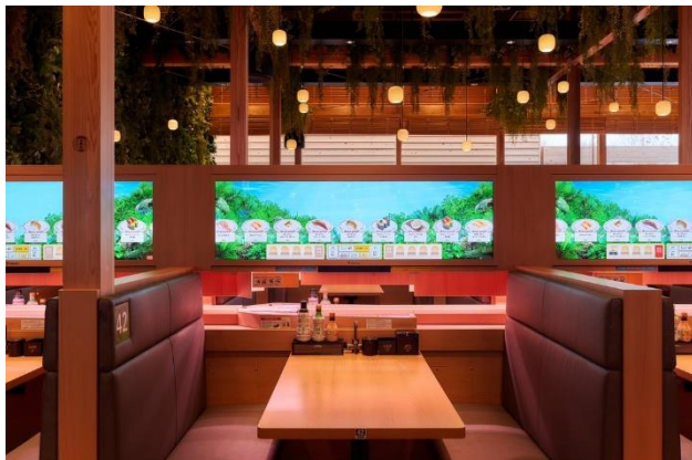
店内には全席デジローを設置

デジタルビジョンと回転レーンが融合したシステム「デジロー（デジタル スシロービジョン）」を全席に設置。水産資源の課題や持続可能な取り組みをゲームを通して学べる「UNI CATCH GAME」を万博限定でご提供いたします。未来にまでつづく楽しい食卓体験のために、デジローを活用し、楽しさを提供していきます。