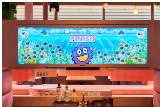
「UNI CATCH GAME」